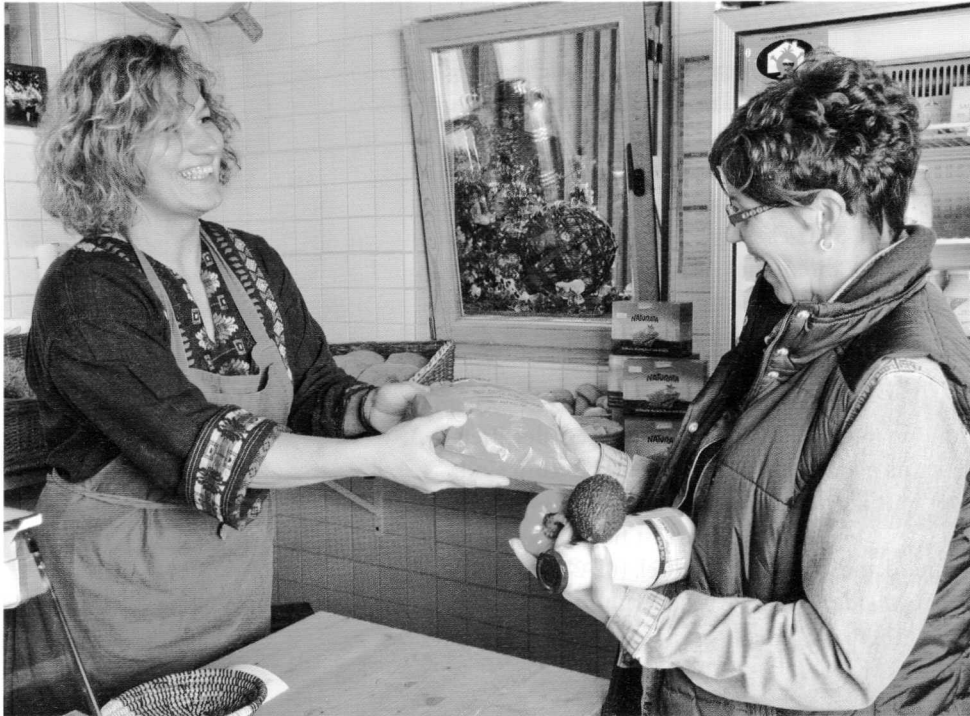
Wenn Sie einen Gutschein für etwas anderes einlösen, ist das ein freundlicher Service für Ihre Kunden. Rechtlich verpflichtet sind Sie dazu nicht.